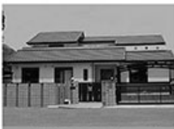
一般住宅の設計・施工・販売

山喜の家づくりは「家」だけではなく、そこに 住むお客様の「暮らし」を大切にされた家づく りです。そんな「心地いい暮らし」を大切に 思いながら、山喜は家づくりをしています。